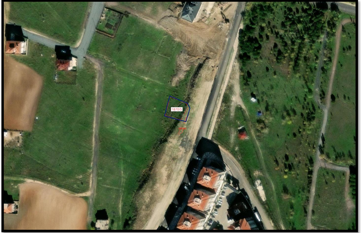
Resim 1: Planlama Alanının Yeri